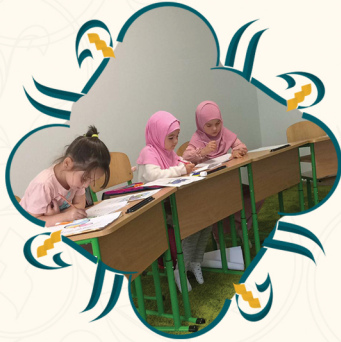
من مدينة كييف

وفي السنة الأولى من التأسيس فتحت الجمعية مدرسة مؤلفة من 6 فصول دراسية في مدينة يالوفا وكذلك مدرسة ابتدائية في مدينة كييف بأوكرانيا لتستوعب 178 تلميذاً وتلميذة، ولكن نظراً إلى أعداد التلاميذ الكبيرة نطمح إلى مدرسة عصرية متكاملة. كما نظمت دورات إتقان القرآن والتعرف بالثقافة الإسلامية لأيتام المهاجرين في مدينة بورصة التركية.