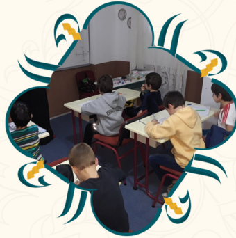
من مدينة يالوفا