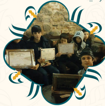
من مدينة بورصا